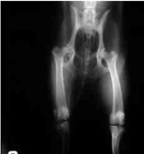
Figura 7. Rx anche del 09/03/02.