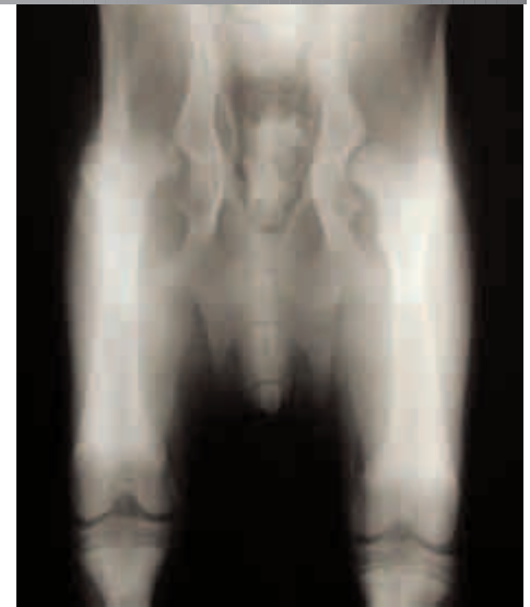
Figura 1. Rx anche cane del 20\09\03.

FULL, cucciolo di Pastore Tedesco di 4,5 mesi di età, che Sabato 20.09.2003 viene portato in Ambulatorio perchè fatica a muoversi. Sottoposto ad esame radiografico mostra una gravissima displasia bilaterale con agenesia degli acetaboli del bacino. Durante la visita presenta dolore ad entrambe le anche nella stazione quadrupedale, alla palpazione e alla manipolazione delle articolazioni.