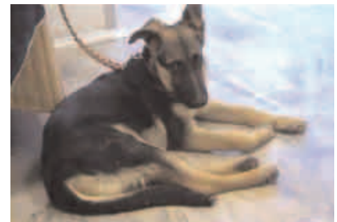
Figura 2. Foto con arti post. Estesi del cane.