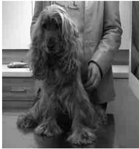
Figura 9. Foto del cane.