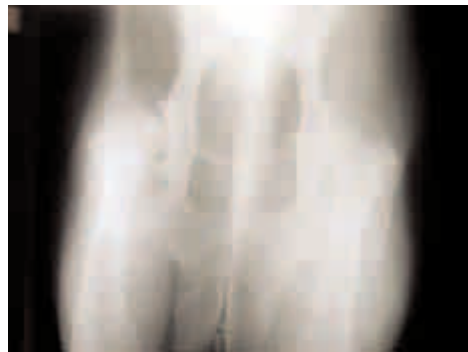
Figure 16-17. Esame radiografico del 11/12/2003.

Presenti gravi segni di sofferenza discale e di demineralizzazione vertebrale. Repertorizzo i sintomi fisici, ma nessuno dei primi 20 Rimedi mi convince. Considero allora l'atteggiamento della cagnolina. Viene definita gregaria, sottomessa alla Pointer più anziana di un anno, la osserva prima di intraprendere qualunque iniziativa. Decisamente insicura, delega le proprie scelte alla sua partner molto più volitiva ed impetuosa. Accetta le coccole, ma sembra non avere il coraggio di chiederle. Di fronte a qualunque scelta traspare insicurezza. Silicea mi convince anche dal punto di vista analogico, perché è un demineralizzato. (Vedi Rx colonna). SILICEA 10.000 K gocce - 3 dosi 3 volte al giorno per 3 giorni. La rivedo dopo una settimana. Dopo una camminata di 3 ore in montagna non ha manifestato alcun dolore! E' molto più tonica, anche se un po' "ballerina" sul posteriore. SILICEA 10.000 K gocce - 1 volta la settimana fino al prossimo controllo.