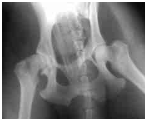
Figura 20. RX anche.

rialzarsi. Lui sembra aiutarsi usando le zampe un po' come stampelle, non flettendo il ginocchio. Questa debolezza è evidente anche nella stazione quadrupedale: dopo poco tempo tende a sedersi e quando cammina si aiuta irrigidendo le zampe e il piede viene portato avanti come fosse un trave. Il risultato non è entusiasmante perché può inciampare mentre cammina. Immagino ci sia un quadro di artrosi perché alla palpazione