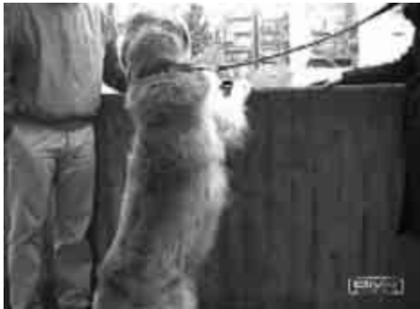
Figure 22. Foto del cane appoggiato al muretto.

NATRUM MURIATICUM 20.000 K - 2 dosi al giorno per 2 giorni. - 2 dosi la settimana come terapia di mantenimento.